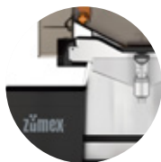
Speed S +plus