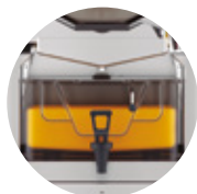
Speed S +plus Tank All-in-One

Wählen Sie den Unterstellwagen je nach Platz und Stil.